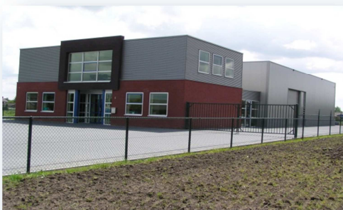
Bedrijfsgebouw + Kantoorruimte