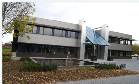
Bedrijfsgebouw + Kantoorruimte