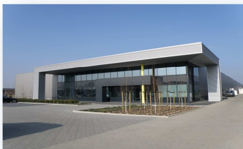
Bedrijfsgebouw + Kantoorruimte