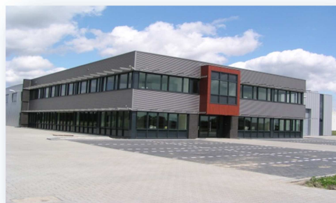
Bedrijfsgebouw + Kantoorruimte